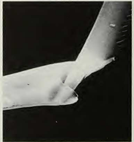
Figura 3.- (Fotografías MEB).. A, Detalle de la inserción de las paleas x900; B, Paleas con costillas longitudinales x500; C, Parte superior de una palea, detalle de su ornamentación x3.300; D, Seda compuesta falcígera, detalle de su articulación x4.800.